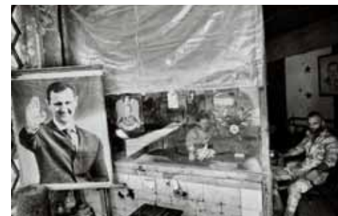
LE MACERIE E LA CAMPAGNA La distruzione avvolge tutti a Homs, città della Siria centro-occidentale: ragazzi, anziani, soldati... Ma Caritas ci crede: "La pace è possibile"