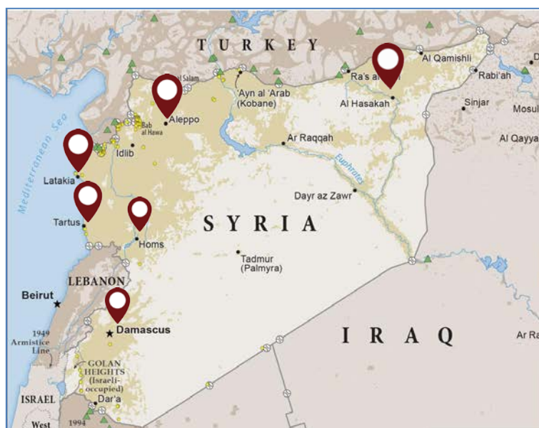
Figura 1: posizionamento degli uffici regionali di Caritas Siria

non, distribuzione di contributi al reddito, assistenza medica e psicologica, sostegno all'educazione scolastica e all'alloggio, protezione per i più vulnerabili (bambini, anziani e donne) 2 .