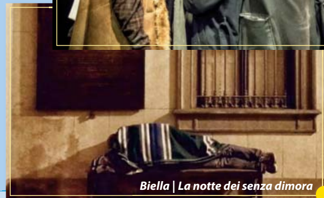
Biella | La notte dei senza dimora

13.30 Pranzo negli hotel 16.00 Tavoli di confronto per il discernimento e la testimonianza 20.00 Cena