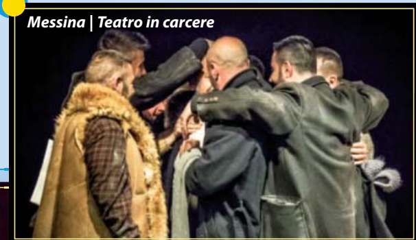
Messina | Teatro in carcere

12.30 Pranzo 15.00 Tavoli di confronto per il discernimento e la testimonianza 18.30 Celebrazione eucaristica 19.30 Cena