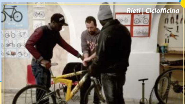
Rieti | Ciclofficina