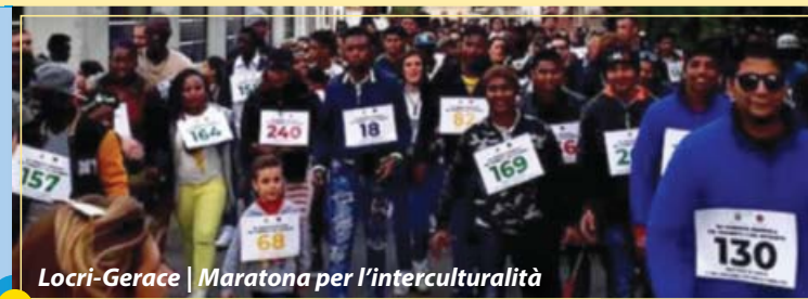
Locri-Gerace | Maratona per l'interculturalità