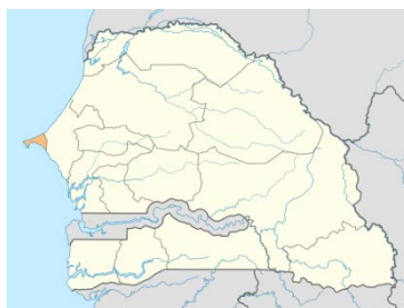
Regione di Dakar