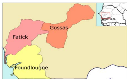
Regione di Fatick

Il presente progetto si realizza a Dakar, sede dell'Arcidiocesi, del Segretariato Generale Caritas Senegal e della delegazione diocesana di Dakar, con i quali Caritas Italiana ha costruito negli anni una profonda collaborazione. La competenza di Caritas Senegal, ente di accoglienza, si estende su 3 regioni: regione di Dakar (Dakar, Guediawaye, Pikine, Rufisque), Fatick (Fatick, Foundiougne, Gossas), Thiès (Mbour). Queste coprono una piccola parte del territorio (km 2 10.087), ma con una popolazione di 3.600.000 sui totali 15 milioni.