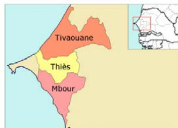
Regione di Thiès (dip. Mbour)

Il quadro sopra delineato permette una lettura del fenomeno migratorio nell'area urbana e le sfide che questo offre . Il Senegal è paese di arrivo (dall'Africa sub-sahariana), transito (verso il Nord Africa) e partenza (verso l'Europa). La migrazione netta è su valori negativi, con il numero di emigrati senegalesi che supera quello degli immigrati che il paese ospita. Nel 2012 la Banca Mondiale segnalava 99.996 emigrati in più rispetto agli immigrati, mentre nel 2007 la differenza era di 166.051. Secondo l'OIM, il trend è in aumento: nel 2017, 556.952 migranti dal Senegal risiedevano all'estero (il 3,42% della popolazione), mentre 265.601 migranti dall'estero erano stabiliti nel paese (il 1,68%). Il movente rimane la ricerca d'opportunità economiche specialmente in Europa, seguita da studio e motivazioni familiari. Oggi la crisi in Europa e quelle dei paesi dell'Africa sub-sahariana aumentano i ritorni volontari, come anche il numero di africani che raggiungono il Senegal da paesi poveri o in conflitto.