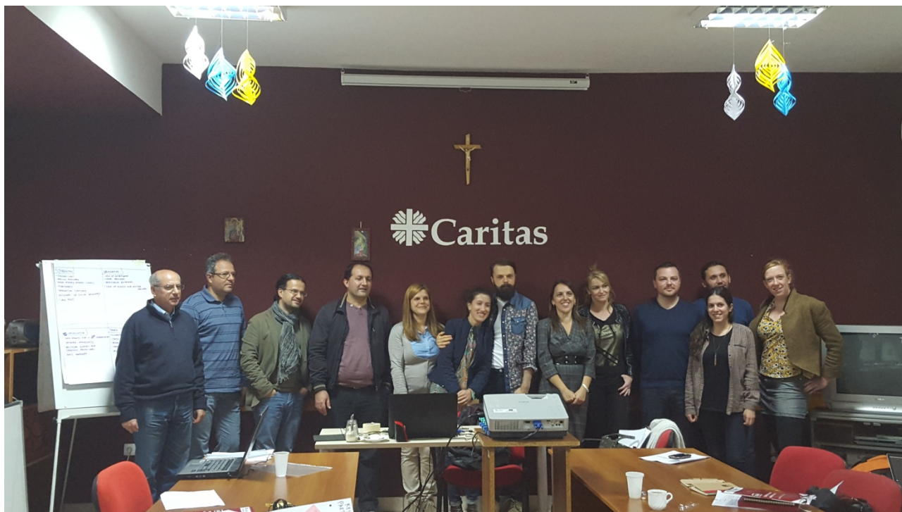
Figura 1: alcuni degli operatori Caritas partecipanti al progetto Elba

Sviluppo socioeconomico, Capacity building