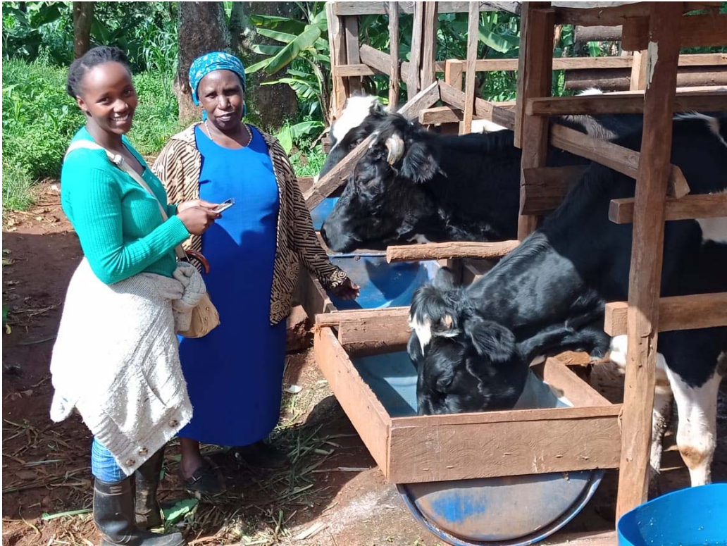
Allevatori coinvolti nel progetto