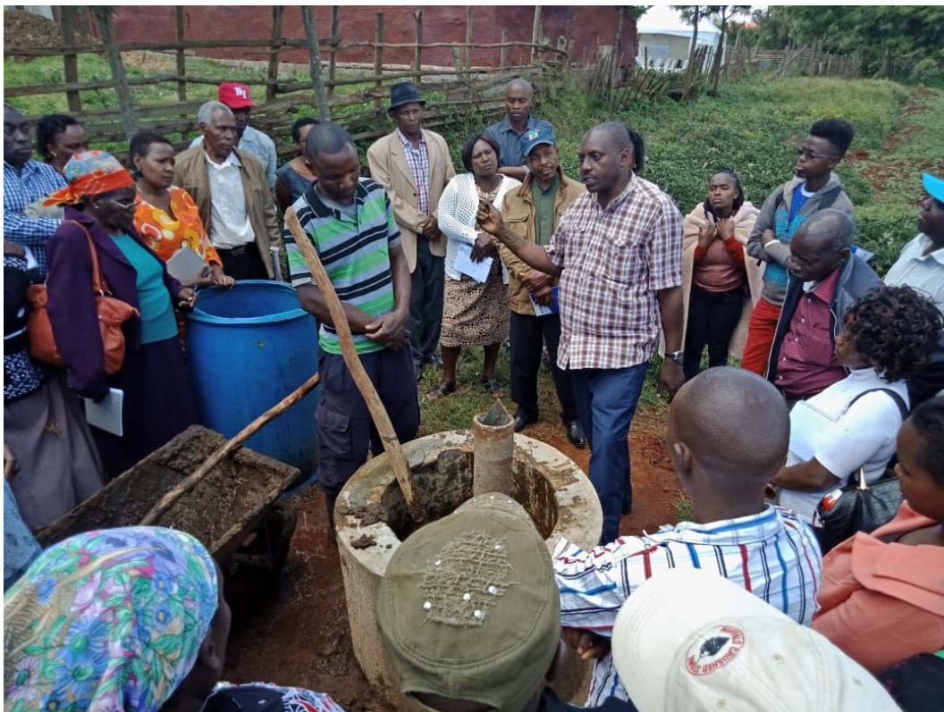
Formazione agli allevatori sull'utilizzo dei digestori di biogas (pre Covid-19)