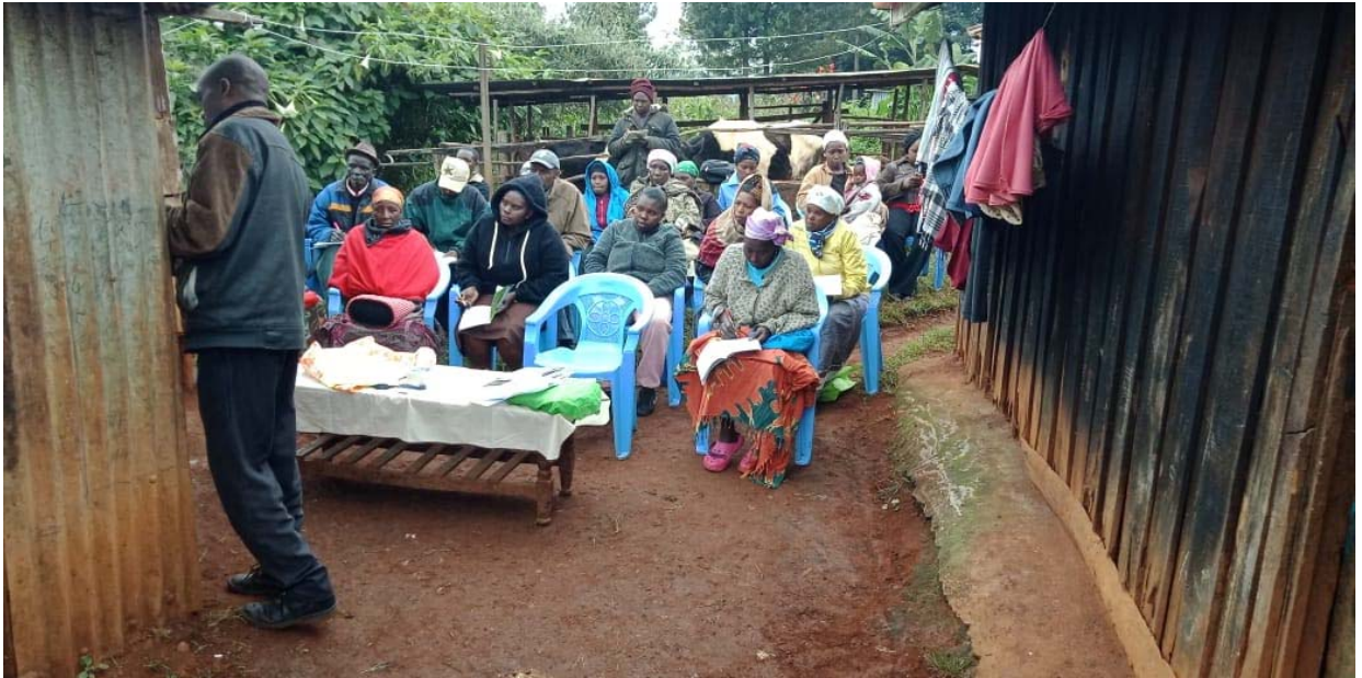
Formazione agli allevatori su nutrizione animale (pre Covid-19)