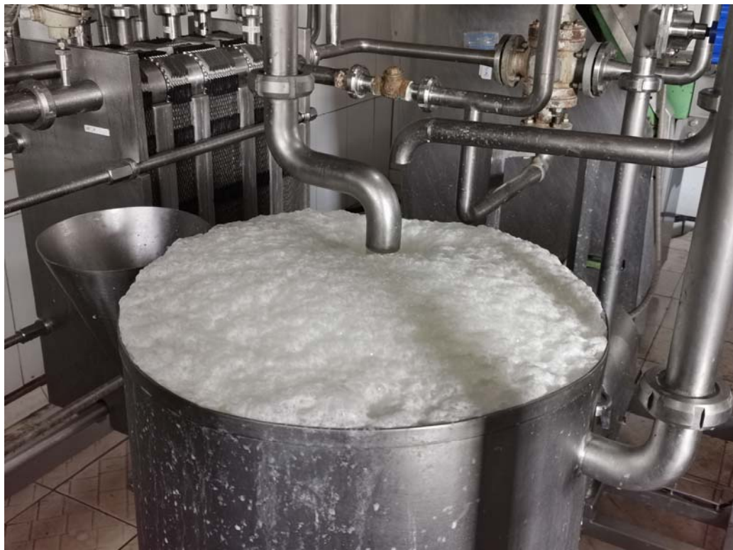
Pastorizzazione del latte