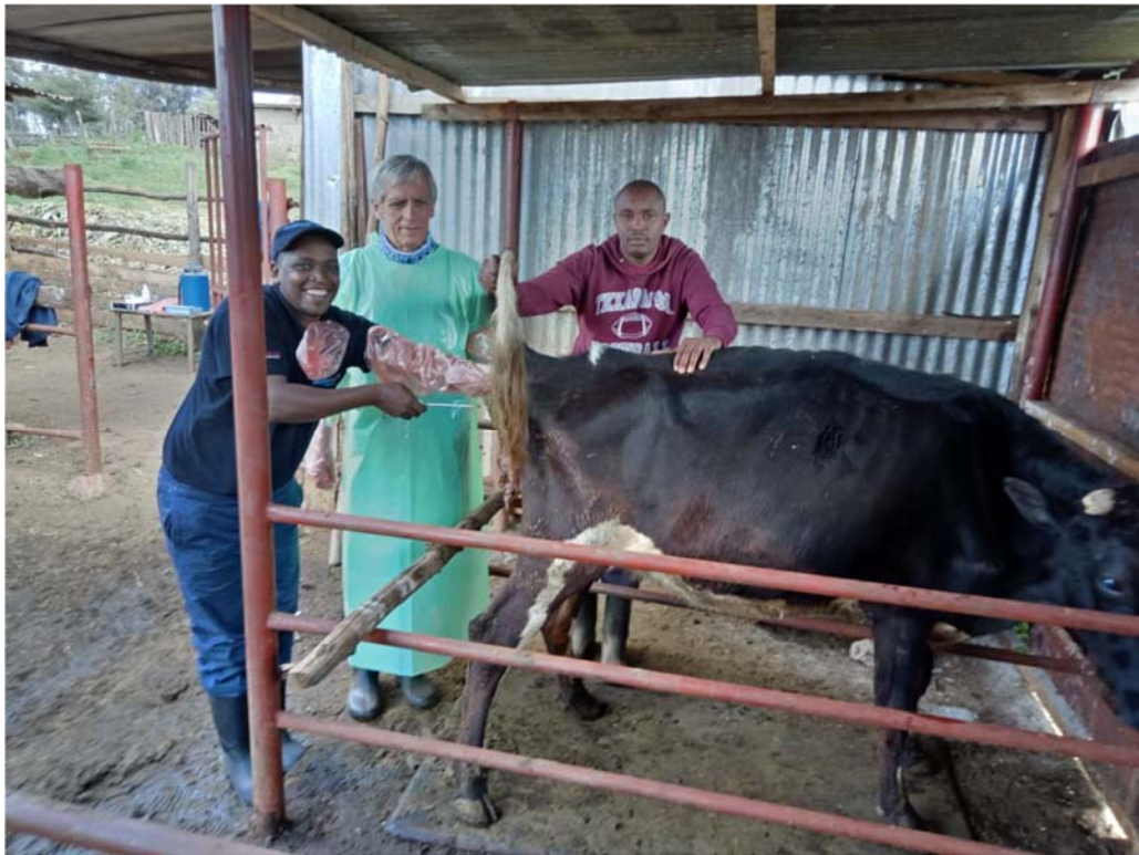
Formazione su inseminazione artificiale (pre covid-19)