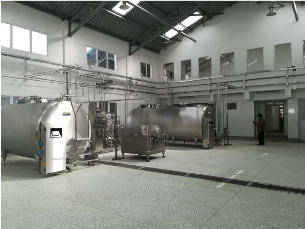
Macchinari per la pastorizzazione del latte acquistati dal progetto Milky installati presso l'Unità di trattamento di Caritas Nairobi