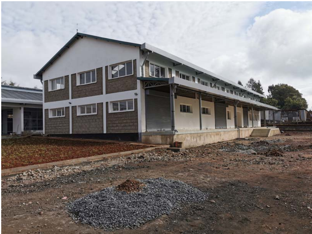
Unità di trattamento del latte di Caritas Nairobi presso la Limuru Archdiocesan Farm