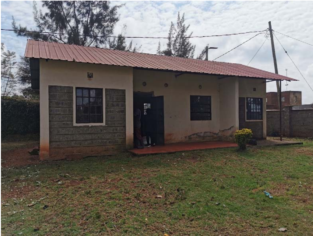
Hub di raccolta del latte