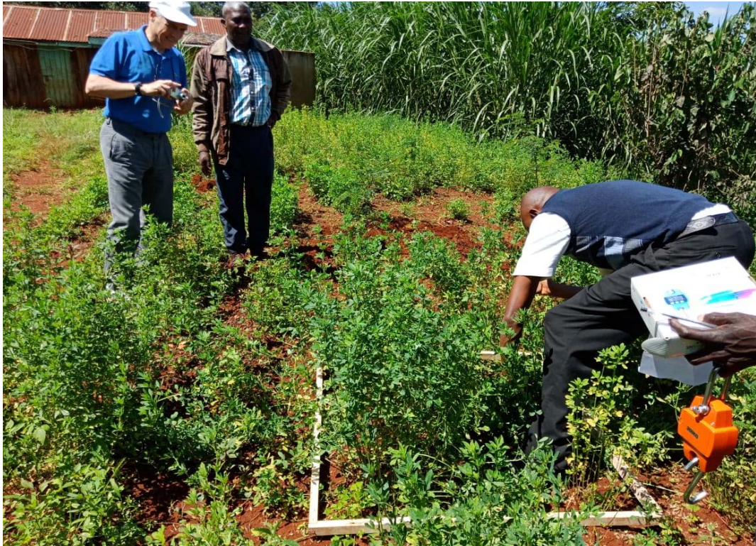
Raccolta di campioni di foraggio per analisi (pre Covid-19)