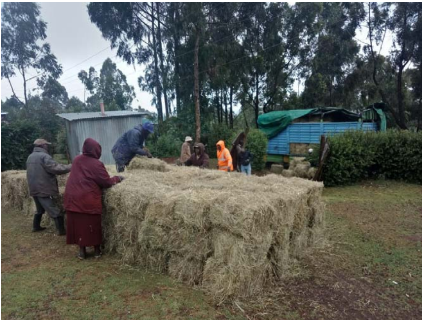
Distribuzione di fieno (pre covid-19)