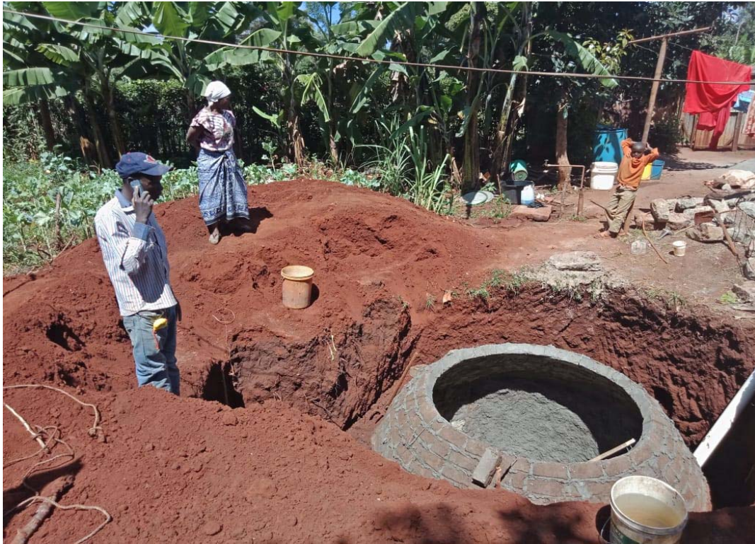
Costruzione di un sistema di biogas