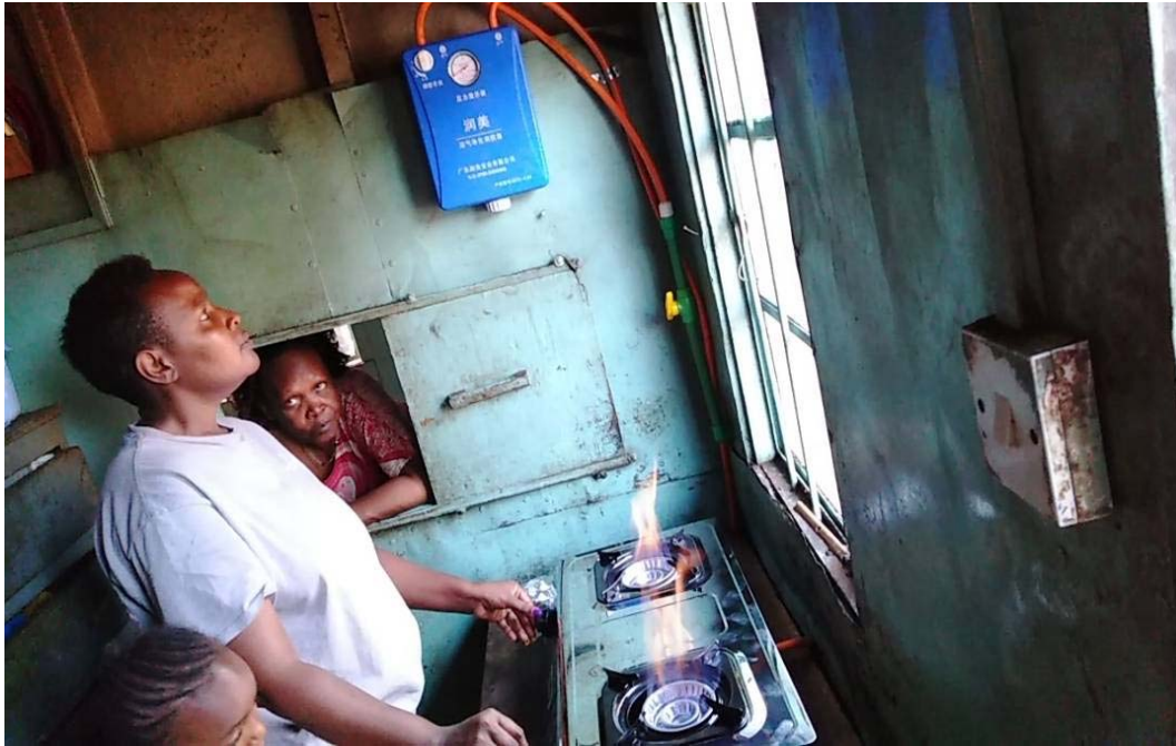
Cucina di uno degli allevatori alimentata con il gas prodotto dal digestore di biogas (pre covid-19)