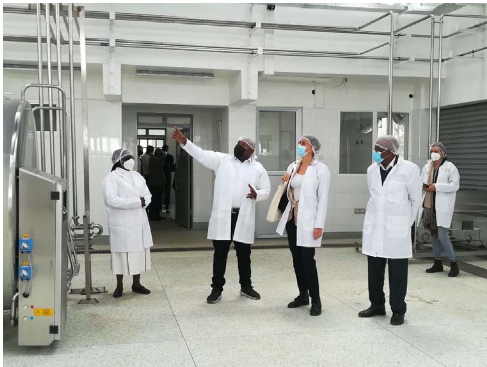
Responsabile di Caritas Nairobi con la rappresentante della sede AICS di Nairobi presso l'unità di trattamento del latte il 23 luglio 2021