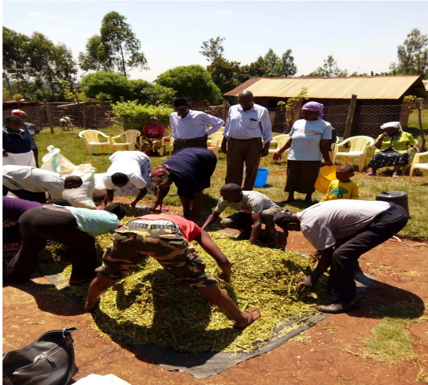
Formazione agli allevatori su conservazione del foraggio (pre covid 19)