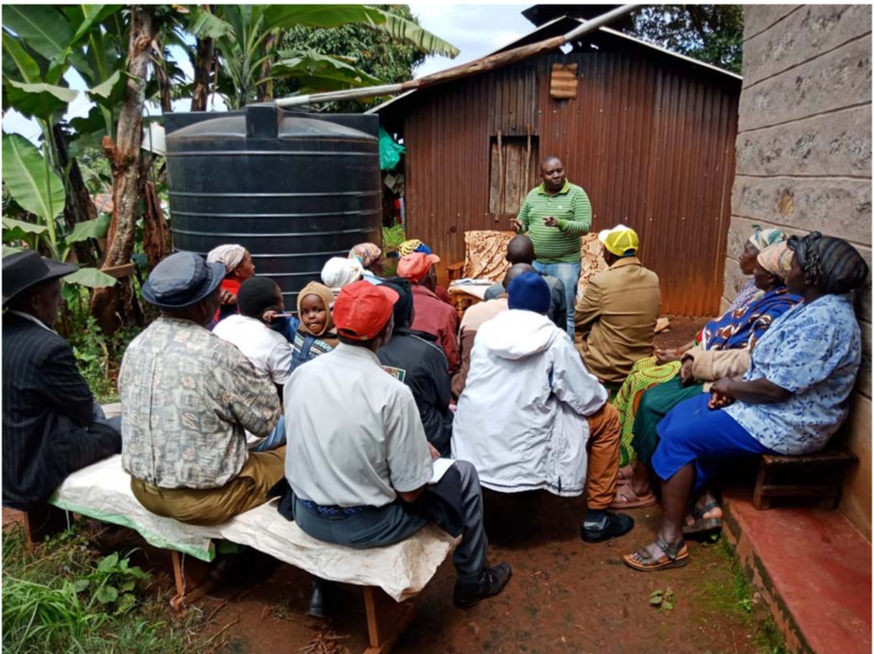
Formazione a gruppo di allevatori su dinamiche di gestione del gruppo (pre-covid-19)