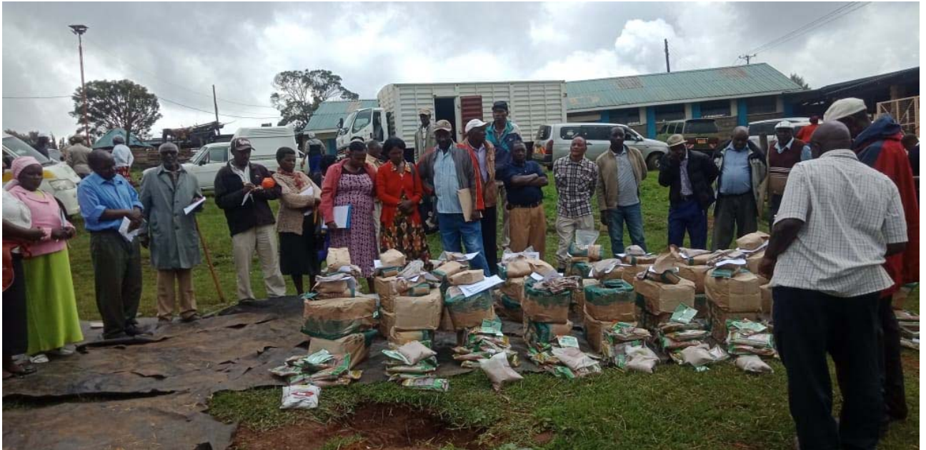
Distribuzione di sementi per la coltivazione del foraggio (pre covid-19)