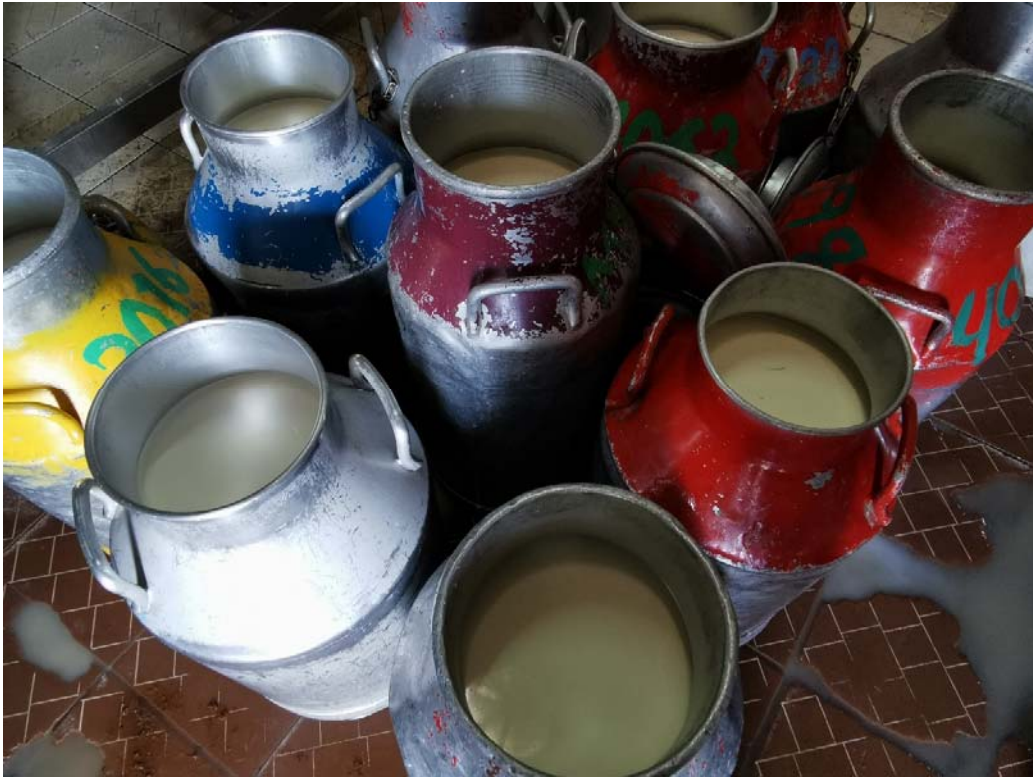
Latte raccolto e consegnato presso un centro di pastorizzazione