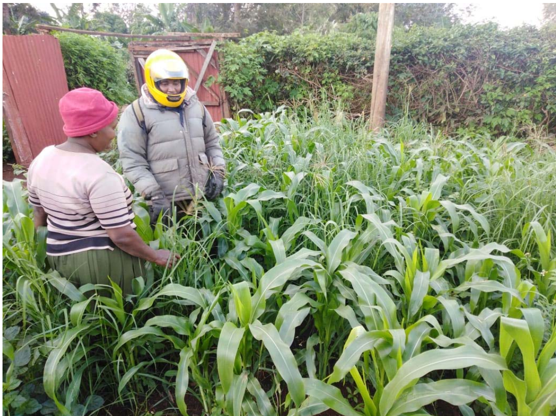
Visita di un formatore alla coltivazione di foraggio di uno degli allevatori (pre covid-19)