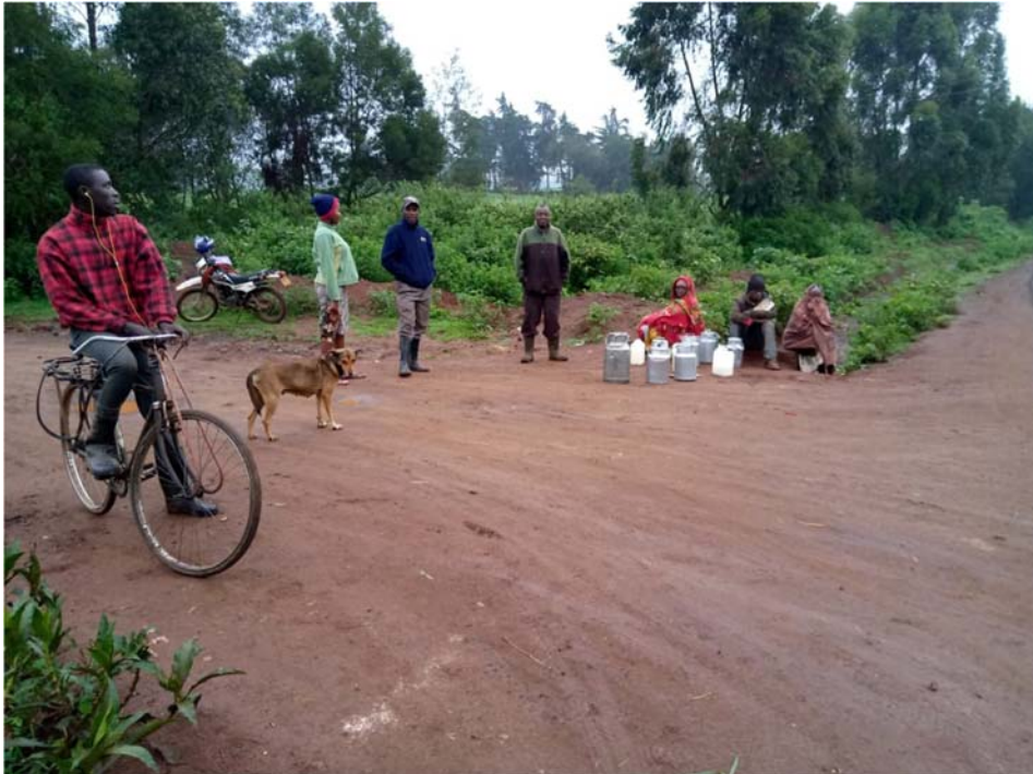
Allevatori in attesa del camion per la raccolta del latte (pre Covid-19)